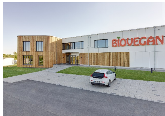
Firmensitz der Biovegan GmbH in Bonefeld (Rheinland-Pfalz)

Ökologisches Engagement ist auch am Firmensitz von BIOVEGAN wiederzufinden. Das nachhaltige Denken und Handeln des Unternehmens, welches BIOVEGAN seit seiner Gründung lebt und ausstrahlt, ist in Bonefeld unverkennbar wiederzufinden. Der Firmensitz in dem ersten ökologischen Gewerbegebiet in Rheinland-Pfalz beherbergt hoch-ökologische Produktions-, Lager- und Verwaltungsstätten. Das Gebäude wurde bereits 2015 mit dem Umweltpreis des Landes Rheinland-Pfalz ausgezeichnet.