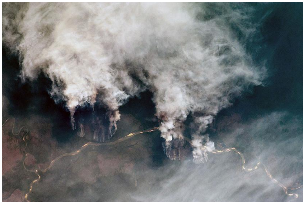
Aufsteigende Rauchwolken im Amazonas

Umweltschützer, indigene Völker, die brasilianische Bevölkerung und die ganze Welt halten den Atem an. Im Schatten der allgegenwärtigen Medienpräsenz der weltweiten Covid-19-Pandemie schreitet die Rodung in den brasilianischen Regenwäldern des Amazonas mit zunehmender Geschwindigkeit voran. Unaufhaltsam verschwinden hektarweise fruchtbare Biotope. Die Kombination aus Rodung und Brandstiftung löscht sowohl das Leben als auch die natürlichen Lebensräume von Flora und Fauna aus.